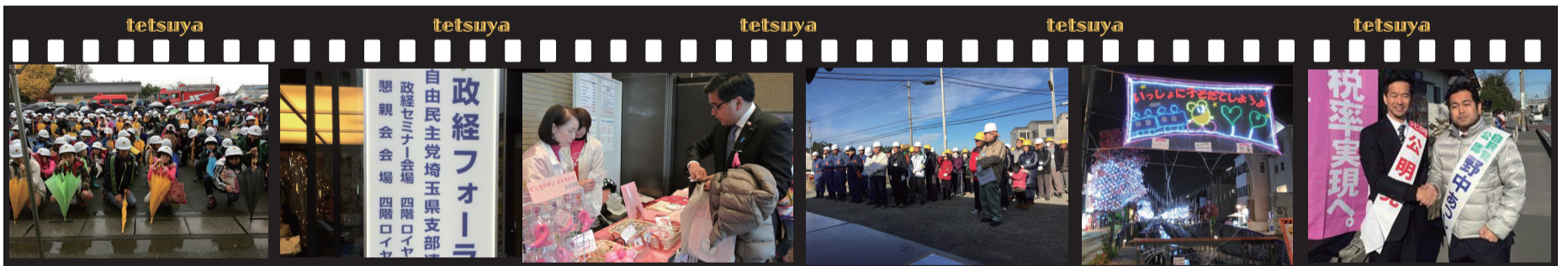
奈良地区の防災訓練