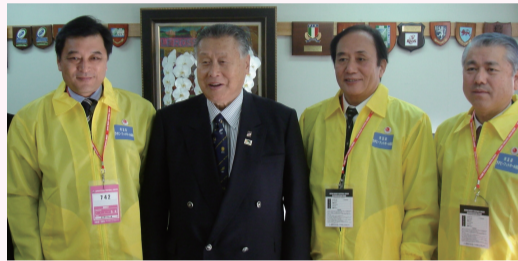
W杯組織委員会副会長・森元首相