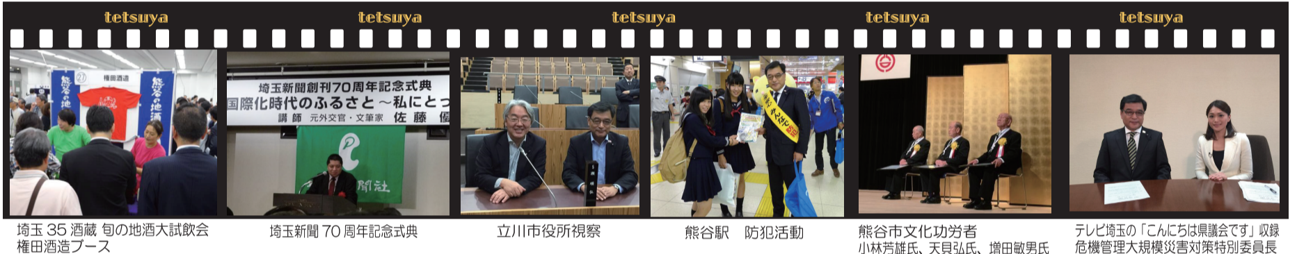
埼玉 35 酒蔵 旬の地酒大試飲会 権田酒造ブース