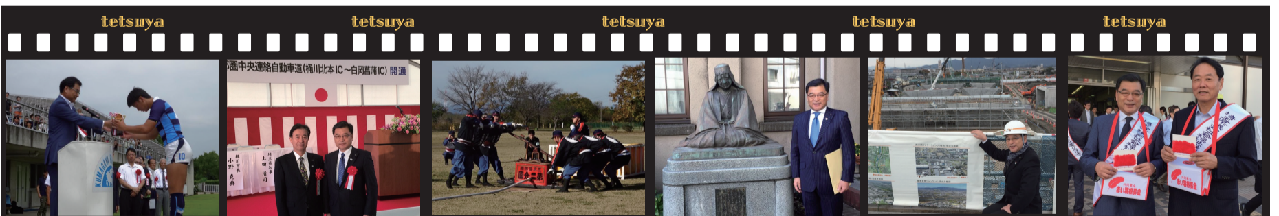
埼玉県高校ラグビー表彰式