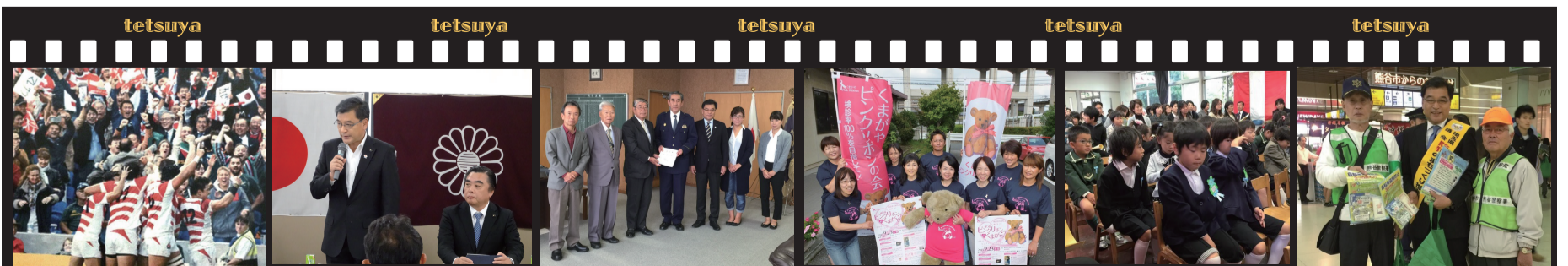
ラグビー日本代表応援