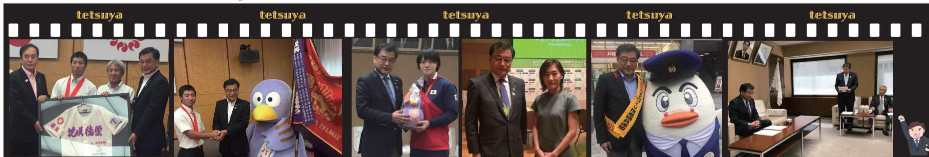
花咲徳栄高校野球部から第99回全国高校野球選手権大会優勝報告