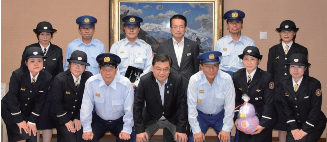
県議会議長室を訪問したメンバー