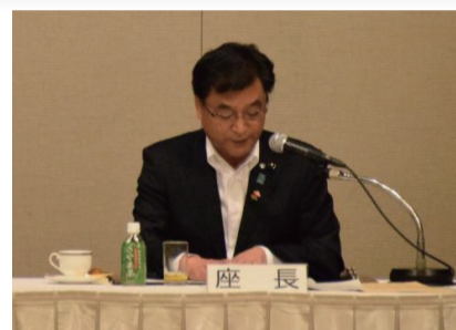
座長を務めるてつや